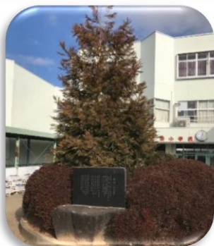
昇降口前にある校歌の石碑