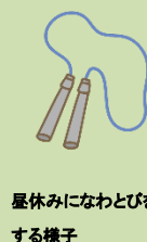
屋休みなわとびをする様子