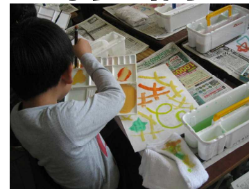
水と絵の具のハーモニー