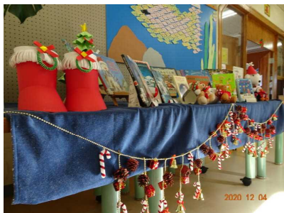
【図書室もクリスマス仕様です】