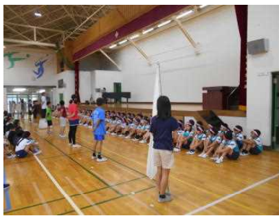
【5年生が先頭に立って開いた壮行会の様子】