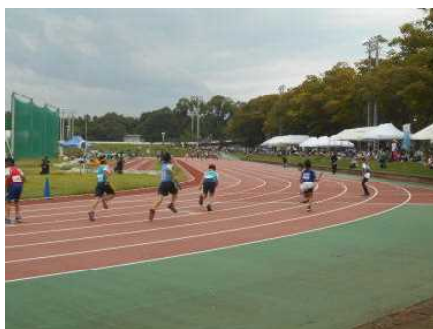
【当日の競技の様子】

〈男子〉 100m (6位) 200m (2位) 60mハードル (5位) 走り高跳び (5位) 走り高跳び (8位) 走り幅跳び (4位) 4×100mリレー (5位)