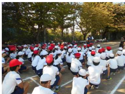
【並木中での練習の様子】